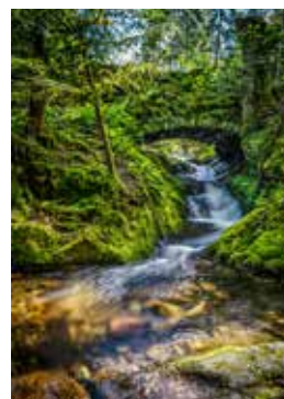
Brückle im Gottschlägtal

an den Getränkebrunnen im oberen Gottschlägtal, an dem ein stetig ansteigender Pfad links Richtung Herrenschrofen/ Karlsruher Grat abzweigt. Von der Felskanzel Herrenschrofen haben Sie einen interessanten Blick auf den tiefen Taleinschnitt des Gottschlägtals. Jetzt sind es nur noch wenige Schritte bis zum Klettersteig am Karlsruher Grat.