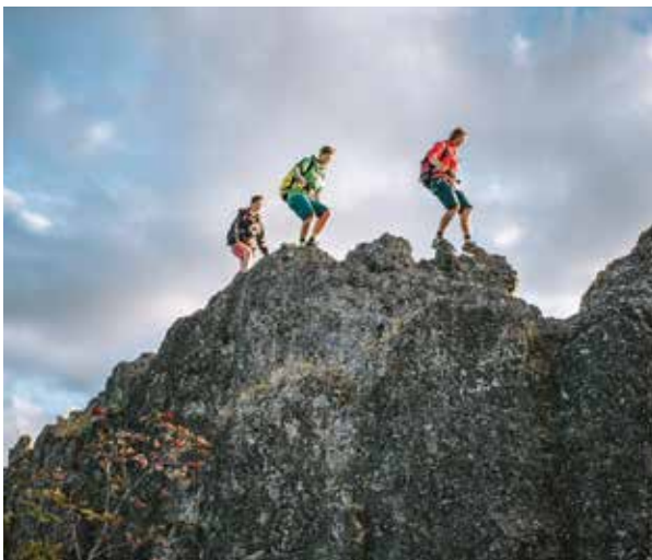
Wer über den Klettersteig will, sollte schwindelfrei sein.

Der Wanderweg führt weiter bis zum „Hotel Sternen“ am Ortseingang ( Hagenbruck ). Nach Überqueren der Edelfrauengrabstraße und der Brücke des Gottschlägbachs kommen Sie auf den Theresienweg, der rechter Hand zurück zum Bahnhof/Kurpark führt.